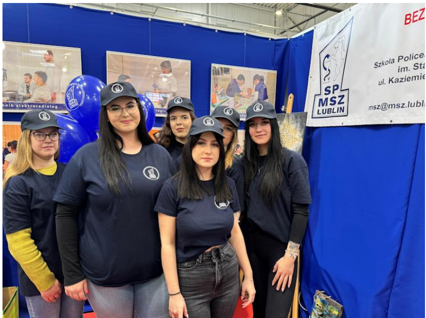
Fot. mgr D. Gołębiowska