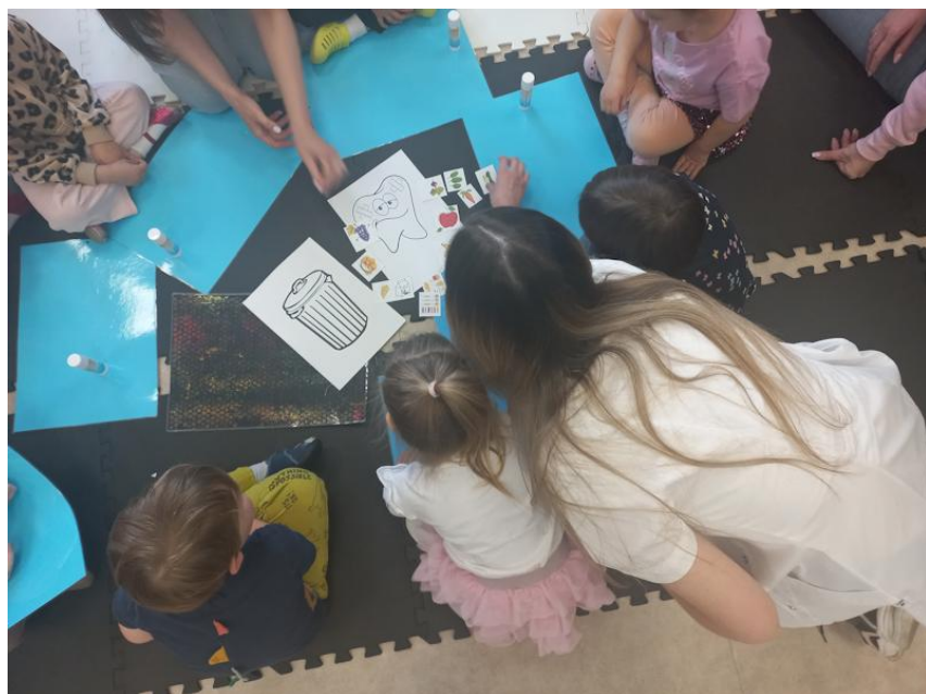
Tekst i fot.: mgr M. Rudawska